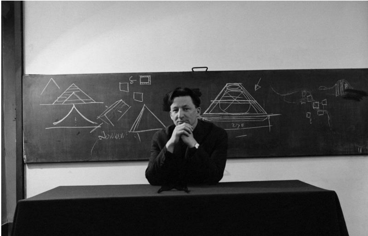
Portret Vjenceslava Richtera

Ovih dana obilježavamo važan jubilej - 70 godina Turističke i ugostiteljske škole Dubrovnik.