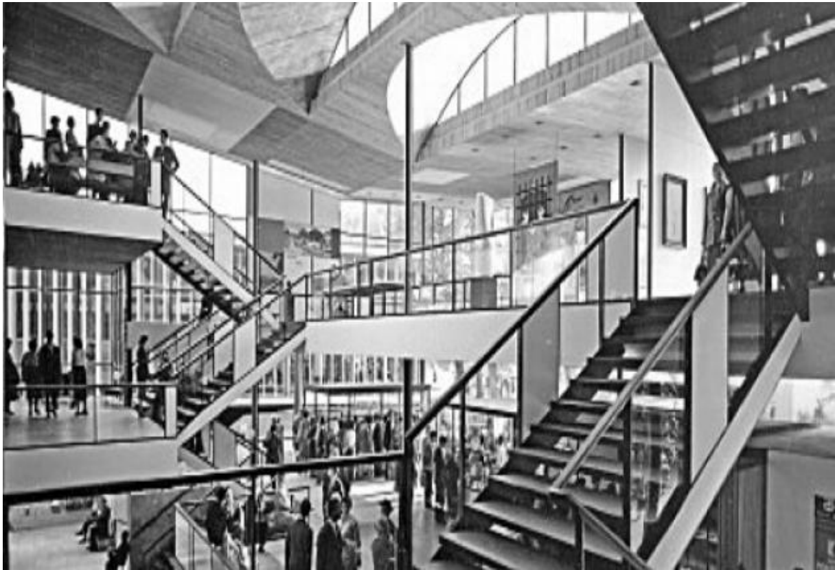
Richterov paviljon za EXPO 1958. g. u Bruxellesu bio je zaista malo remek djelo.

Njegovi su bestežinski, međusobno spojeni volumeni izgledali kao da lebde iznad platoa popločenog mramorom stvarajući tako dinamičnu kaskadu prostora koji teku, bez prepreka između eksterijera i interijera, a poslužit će kao predložak za novu zgradu Ugostiteljske škole u Župskoj 2, Dubrovnik.