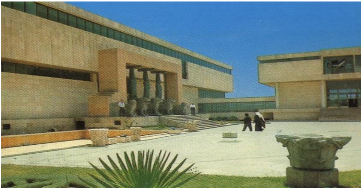
Nacionalni muzej u Alepu, autori: Zdravko Bregovac i Vjenceslav Richter

Vjenceslav Richter bio je majstor povezivanja, vizionar koji je realizirao projekte po čitavom svijetu, među ostalima i u sirijskom Alepu. S kolegom Zdravkom Bregovcem 1975. je u svega pet dana projektirao tamošnji Nacionalni muzej, koji unatoč brojnim razaranjima proteklih godina, još uvijek u središtu Alepa!