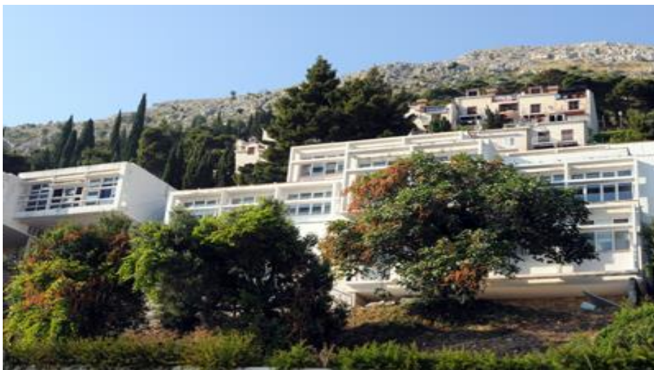
Turistička i ugostiteljska škola Dubrovnik

Njegovi su bestežinski, međusobno spojeni volumeni izgledali kao da lebde iznad platoa popločenog mramorom stvarajući tako dinamičnu kaskadu prostora koji teku, bez prepreka između eksterijera i interijera, a poslužit će kao predložak za novu zgradu Ugostiteljske škole u Župskoj 2, Dubrovnik.