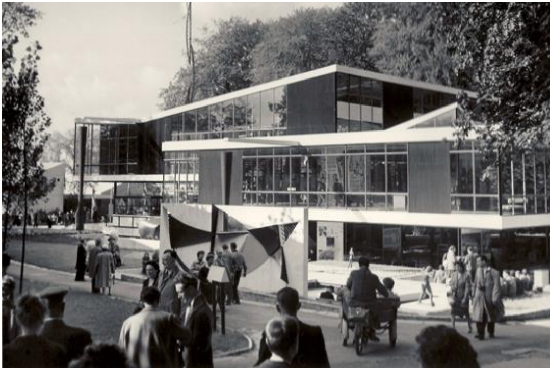
Arhitektura za bolji svijet; Paviljon Jugoslavije na EXPO 1958.

Treba napomenuti da je Richter, između ostalog, autor projekata Vile Zagorje za potrebe bivšeg jugoslavenskog predsjednika Josipa Broza Tita. Građena je od 1963.do 1964.g, a 1992. g. postaje službena rezidencija predsjednika Republike Hrvatske- Predsjednički dvori .